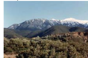
Le parc National du Toubkal

et culturelle, d'environnement, d'éthique, d'écotourisme et enfin certaines techniques d'expression et de communication.