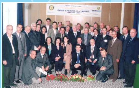
SFPE en Tunisie