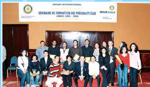
Le Gouverneur avec les Rotaractiens du Maroc