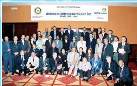
Les présidents du Maroc et de Mauritanie