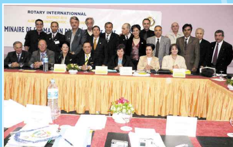
SFPE en Algérie