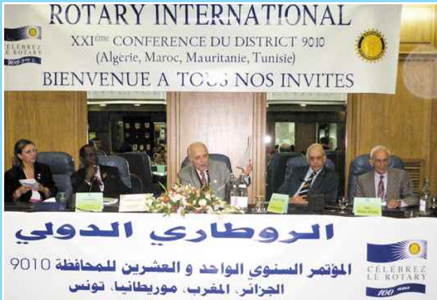
Ouverture de la XXI ème Conférence du District 9010 Tunis