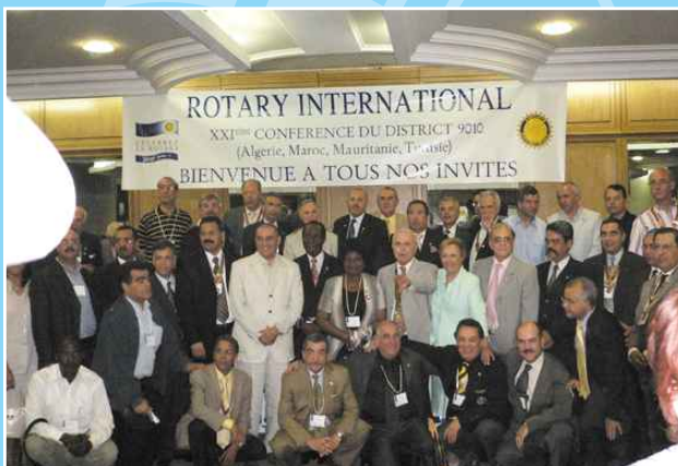
Photo souvenir des Rotariens du District avec le Gouverneur Nooten CHELBI