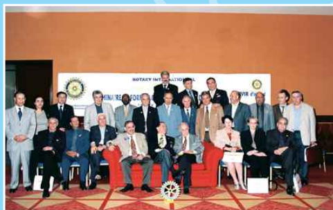
Les dirigeants du District