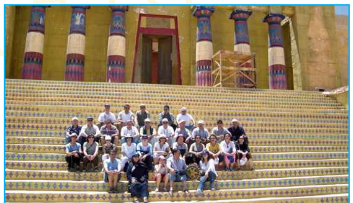
Visite des Studios Atlas où a été tourné Astérix et Obélix

C'est un pari humanitaire qui a duré une semaine, l'humanitaire coulait dans les veines des participants qui étaient convaincus que l'utopie de l'amitié permet encore aujourd'hui de construire, petit à petit, un mieux être pour les défavorisés de notre pays.